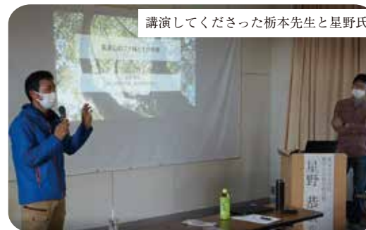
講演して下さった栃本先生と星野氏