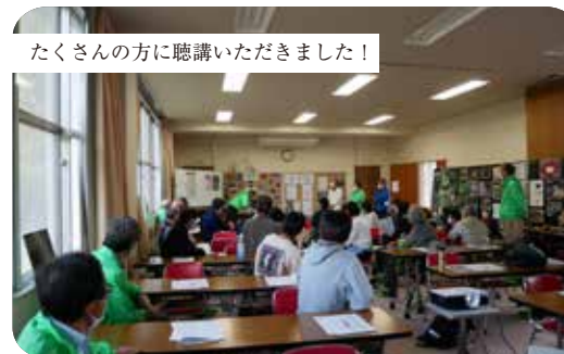
たくさんの方に聴講いただきました！