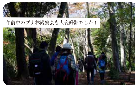
午前中のブナ林観察会も大変好評でした！